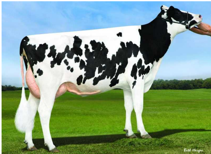
S-S-I Moonray Myesha - 4. gen. M