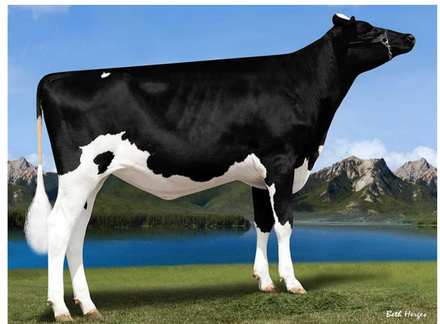
Peak Zenith - MMM