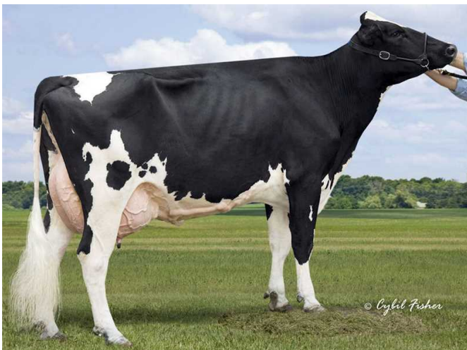
Clear-Echo 822 Ramo 1200 - 5. generace M