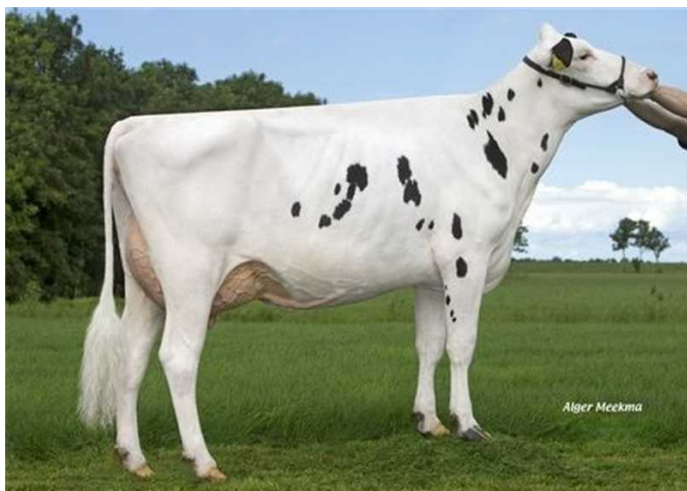
Koepon Bkm Regenia 104 - 4. gen. M