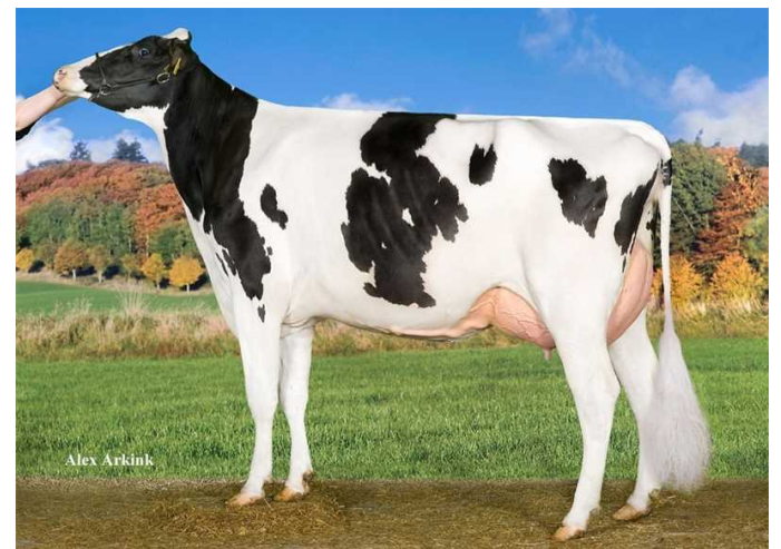
Tirs vad Bookem Nessie - MMM